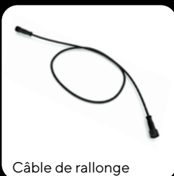
Câble de rallonge